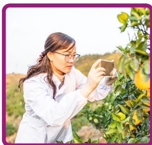
TÉCNICO EM AGROPECUÁRIA