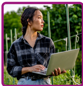
TÉCNICO EM AGRICULTURA

EM BREVE EM BREVE EM BREVE EM BREVE EM BREVE EM BREVE EM BREVE