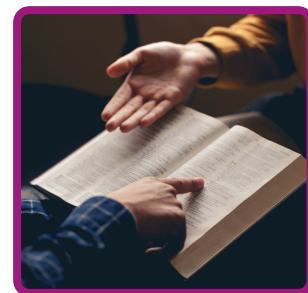
TÉCNICO EM TEOLOGIA