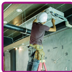
TÉCNICO EM REFRIGERAÇÃO & CLIMATIZAÇÃO